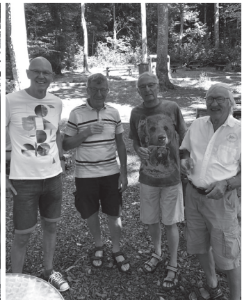
Les photos sont visibles sur notre site www.aref-rvsf.ch , rubrique Galerie. Die Fotos sind aufgeschaltet auf unserer Webseite www.aref-rvsf.ch , Rubrik Fotogalerie.