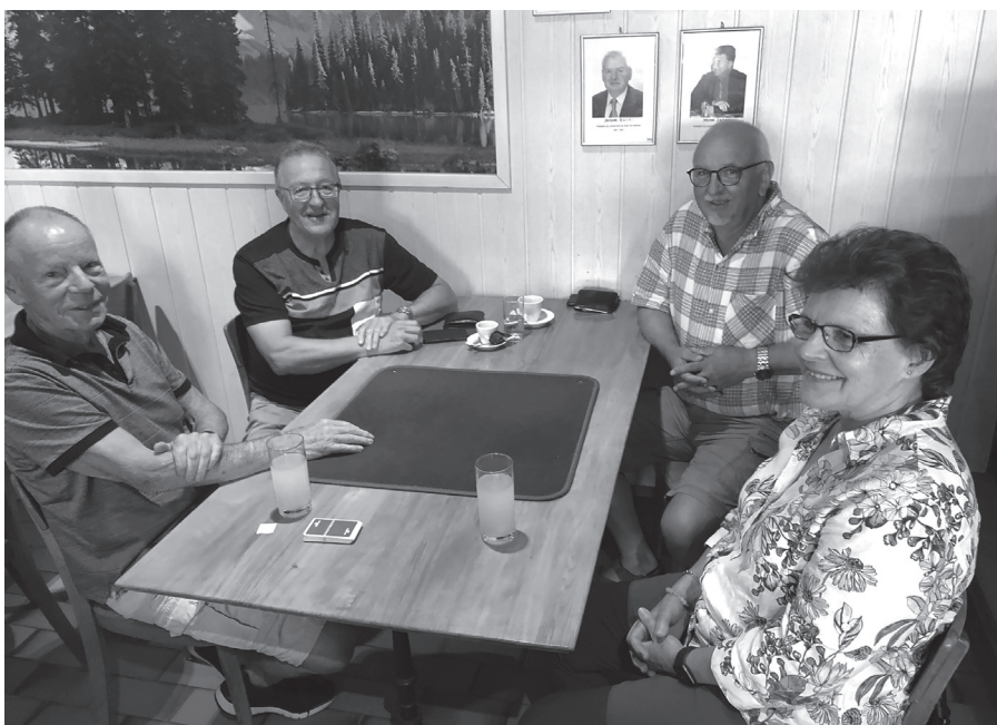
Les photos sont visibles sur notre site www.aref-rvsf.ch , rubrique Galerie. Die Fotos sind aufgeschaltet auf unserer Webseite www.aref-rvsf.ch , Rubrik Fotogalerie.