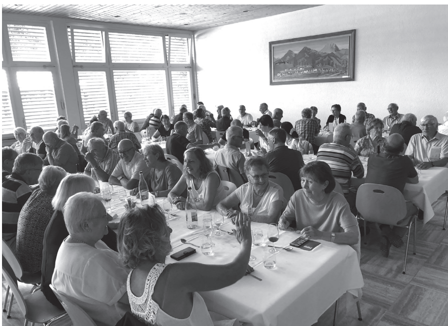
Les photos sont visibles sur notre site www.eref-rvsf.ch , rubrique Galerie. Die Fotos sind aufgeschaltet auf unserer Webseite www.eref-rvsf.ch , Rubrik Fotogalerie.