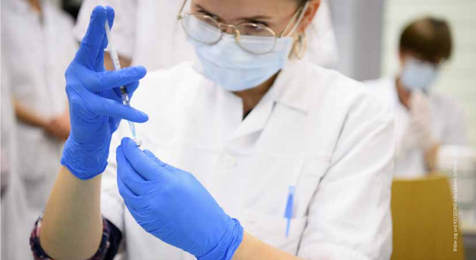
Bildergang und