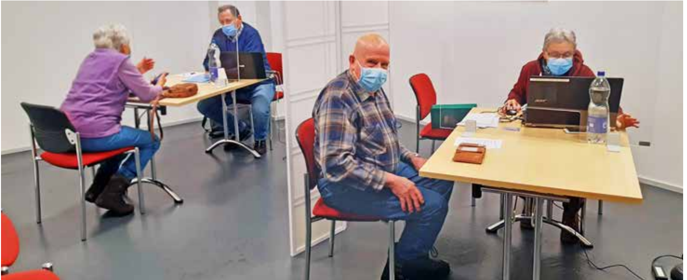
15 IT-affine ältere Menschen helfen für Pro Senectute Kanton Glarus bei den Anmeldungen zur COVID-19-Impfung.

Senioren helfen Senioren: Wer im Kanton Glarus mit der Anmeldung zur COVID-19-Impfung übers Internet nicht zurechtkommt, erhält auch hier Hilfe von Pro Senectute. Das Angebot von Pro Senectute Kanton Glarus entstand in nur wenigen Tagen.